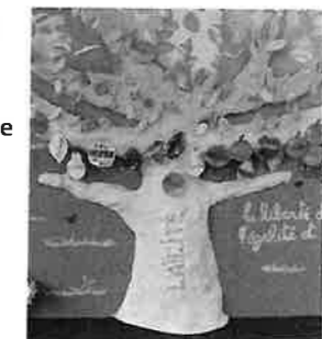
Cérémonie de la laïcité, école Jean-Jaurès, Troyes (10), décembre 2015.

Réaliser le mur ou l'arbre de la laïcité Par groupe, faites la liste des mots qui sont liés à cette valeur républicaine. Puis, sur des feuilles de couleur décorées, écrivez ces mots. Ainsi, vous pourrez les afficher sur un mur ou les accrocher à un arbre.