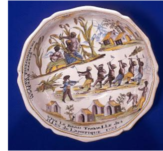
3 Un commerce « fort considérable »