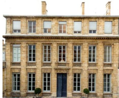
2 L'hôtel particulier de Nairac appartient à un négociant qui s'est enrichi dans le commerce du sucre

Le commerce de Bordeaux est fort considérable ; le principal se fait dans les îles : Bordeaux y porte des vins et du blé, de la quincaillerie, des verroteries 1 , des draps, etc. Elle achète en France ce qu'elle porte en Amérique ; ainsi ce commerce est fort avantageux au royaume. Le vin est la branche la plus avantageuse à Bordeaux même, puisque c'est une richesse qui se renouvelle tous les ans. Plusieurs personnes m'ont dit que les deux tiers des habitants de Bordeaux étaient occupés au vin. 1 D'après François de la Rochefoucault, Récit de voyage , 1783.