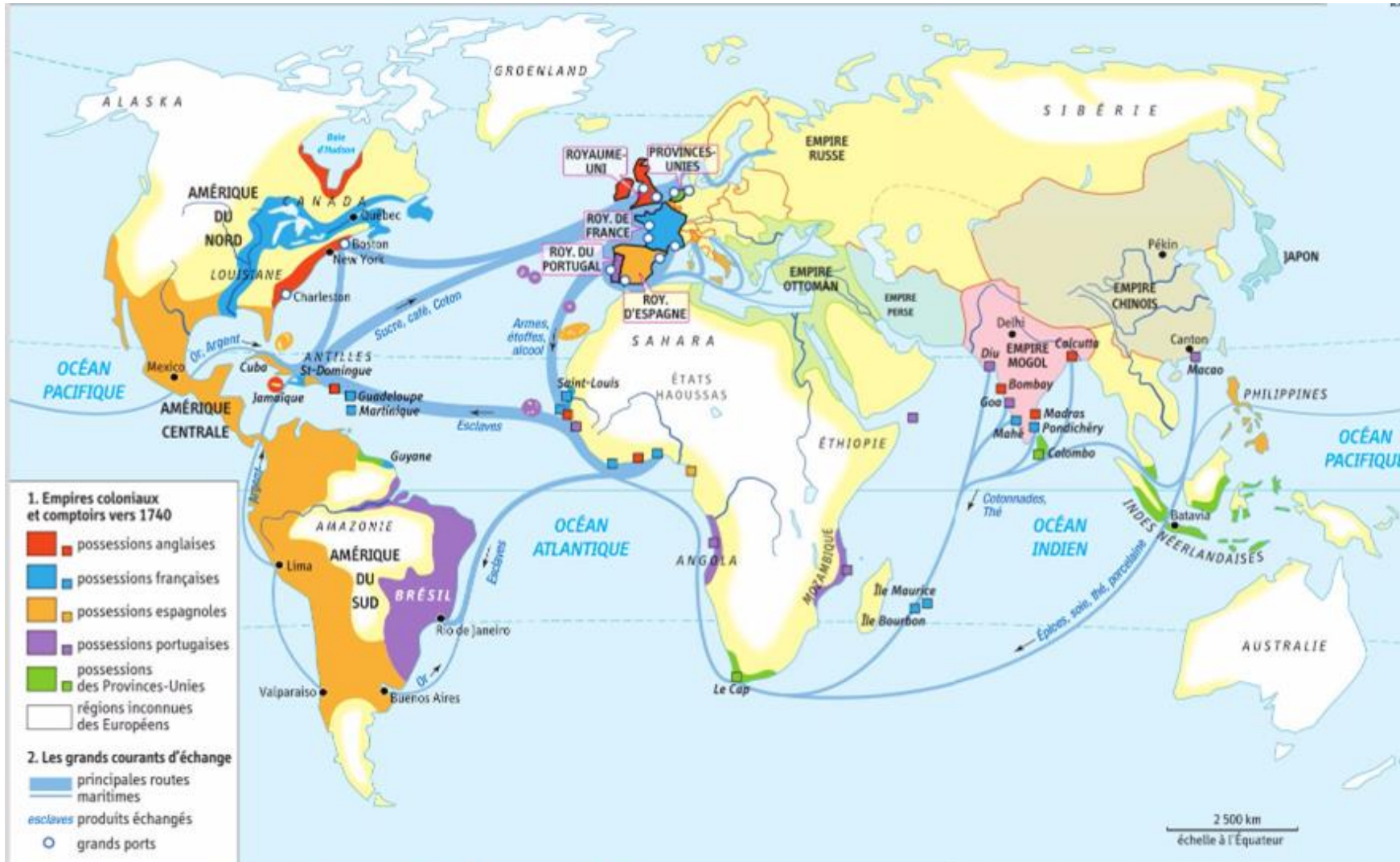
Les empires coloniaux et les grands courants d'échanges vers 1740

Au milieu du XVIIIe siècle, les Etats d'Europe de l'Ouest possèdent d'importantes colonies, surtout situées en Amérique. L'essentiel du commerce maritime mondial se fait alors entre l'Europe et ses colonies.