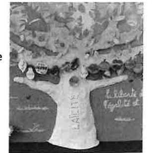
Cérémonie de la laïcité, école Jean-Jaurès, Troyes (10), décembre 2015.

Réaliser le mur ou l'arbre de la laïcité Par groupe, faites la liste des mots qui sont liés à cette valeur républicaine. Puis, sur des feuilles de couleur décorées, écrivez ces mots. Ainsi, vous pourrez les afficher sur un mur ou les accrocher à un arbre.