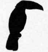
Toucan à bec rouge Ramphastos tucanus