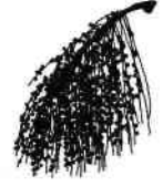
Des fruits de wassaï Euterpe oleracea