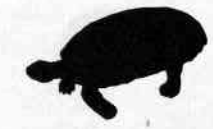
Tortue charbonnière Cheloidis carbonaria