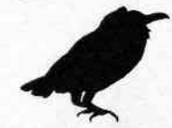
Coracine chauve Perissocephalus tricolor