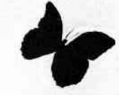
Morpho Morpho retenor

4 Entoures en bleu un mammifère en rouge un oiseau en vert un insecte