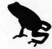
Dendrobate Dendrobates tinctorius