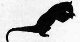
Tamandua Tamandua tetradactyla